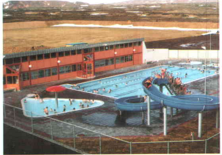
Las aguas termales permiten el suministro de calefacción al 86 por ciento de la población y agua caliente natural para más de un centenar de piscinas públicas.

ularios, servicios para la tercera edad, terapia ocupacional, comedores y asistencia domiciliaria. También ofrece albergues, servicios para minusválidos, ayuda a alcohólicos, registro de parados y centros de empleo.