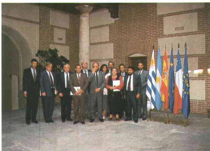
Los pasantes de este curso en la sede de la FEMP.

En la primera de ellas los participantes se entrevistaron con responsables de diversas instituciones relacionadas con las Administraciones Locales y mantuvieron reuniones de trabajo con miembros de la FEMP, el Instituto Nacional de Administración Pública (INAP), la Agencia Española de Cooperación Internacional (AECI), la Agencia de Medio Ambiente de la Comunidad de Madrid (AMA) y los Ayuntamientos de Leganés y Madrid. En los días sucesivos visitaron las Diputaciones Provinciales de Albacete, Alicante, La Coruña,