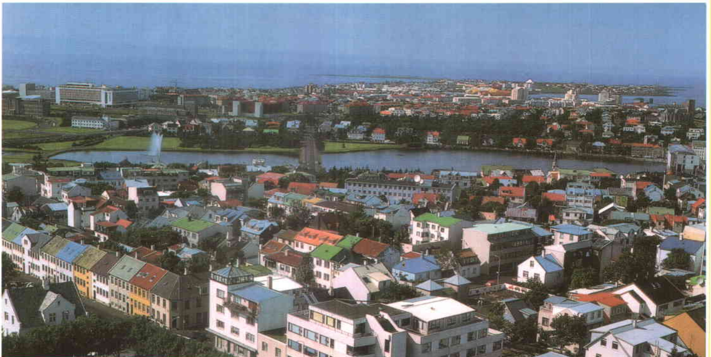
Vista general de Reikjavik, la capital del país, con poco más de cien mil habitantes.

La Declaración enfatiza sobre el incremento de la cooperación, especialmente de las Corporaciones Locales nórdicas, sin tener en cuenta la naturaleza de las relaciones entre los Gobiernos nórdicos y otros Estados europeos, ya que sólo Dinamarca es miembro de la Unión Europea (UE) y que otros tres países (Finlandia, Noruega y Suecia) han convocado un referéndum para el próximo mes de noviembre sobre su adhesión a la UE, mientras que Islandia no está interesada en incorporarse. ■