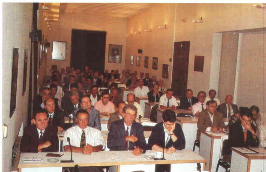
Alcaldes de los municipios afectados por las centrales de producción hidroeléctrica, durante la reunión celebrada en la sede de la FEMP.

1992 con el objeto de fortalecer y mejorar la imagen de las ciudades españolas en el sector de congresos, convenciones y viajes de incentivos, dada la importancia que el turismo de negocios o reuniones adquiriría en España.