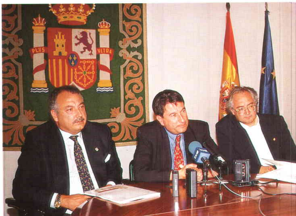
El Consejo Federal exigió el abono inmediato de las cantidades pendientes de 1993, a cuenta del posible acuerdo entre Hacienda y la FEMP sobre la liquidación definitiva