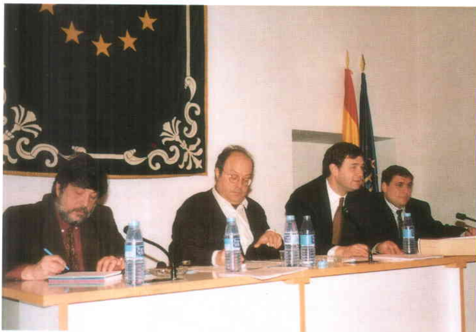
Técnicos del MOPTMA y de la FEMP durante la jornada de trabajo.

La utilización masiva de la vía de urgencia, que ha convertido el carácter de "urgente" en un mero requisito formal sin sentido alguno, ha provocado numerosos retrasos y dificultades, sobre todo a la Administración Local que, para obtener la declaración de expropiación, depende del órgano colegiado supremo de la Comunidad Autónoma respectiva. Por otro lado, el actual procedimiento de tasación conjunta implica la intervención de la Comunidad Autónoma y del Jurado de Expropiación en las intervenciones expropiatorias de la Administración Local, lo