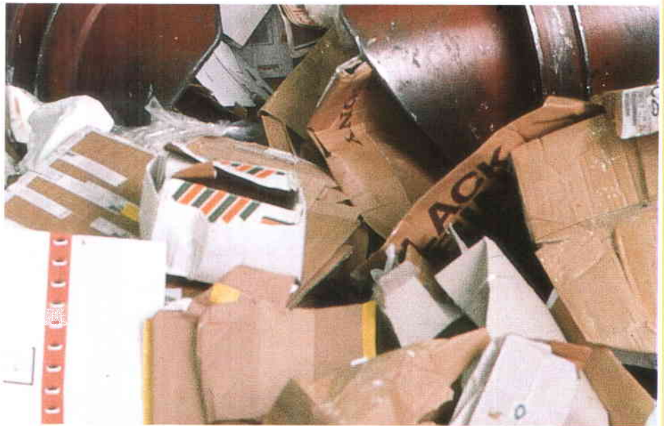
El documento indica que además de las Administraciones Locales, que tienen competencia sobre recogida y tratamiento de residuos, los usuarios podrán solicitar la instalación de contenedores para los casos de residuos especiales.

El Ministerio de Obras Públicas, Transportes y Medio Ambiente (MOPTMA) y la FEMP han elaborado un Modelo de Ordenanza Municipal de Protección Ambiental que orienta la regulación municipal de actividades que alteren la calidad medioambiental, las medidas de inspección y control de dichas actividades, así como la tipificación de infracciones y su procedimiento sancionador. El documento, que acaba de ser editado por la Dirección General de Política Ambiental dentro de su colección de monografías, es el resultado de la colaboración entre el MOPTMA y la FEMP al amparo de un convenio específico firmado en 1990.